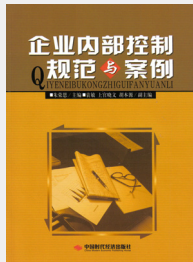
企业内部控制与案例