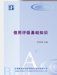
信用评级基础知识